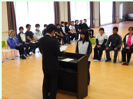
入所式にて理事長、辞令交付！