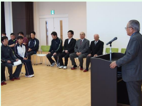
入所式にて会長挨拶！