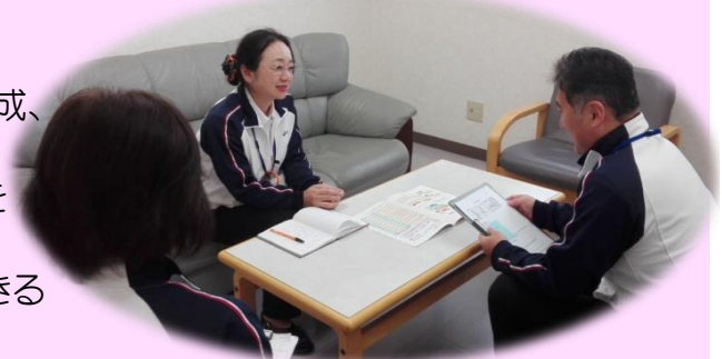
担当者会議を想定した指導訓練の様子

実習生に様々な指導を行う中で、自分達も少しでも成長できるように今後も努めてまいります。