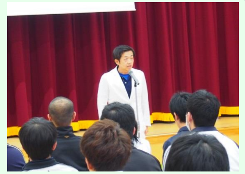
互助会総会にて互助会会長挨拶！