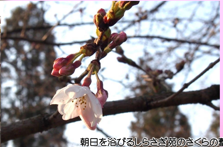
朝日を浴びるしらさぎ苑のさくらの蕾