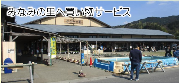
みなみの里へ買い物サービス