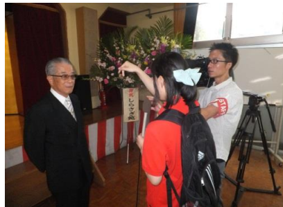
ケービレッジ 取材