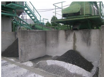
その1 工場の様子や材料の保管状況等を確認する。