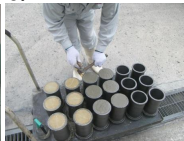
その6 最後に試験体を作成し、後に養生期間に応じた圧縮強度試験を行い、どの程度の圧力まで破壊されることなく強度を維持できるかのテストを行う。