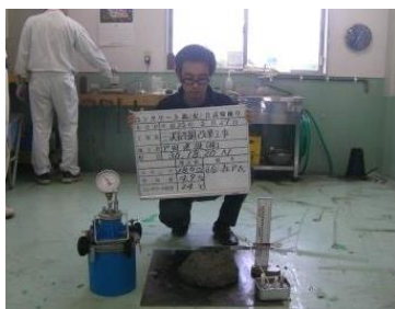
その5 スランプ試験器具をゆっくり引き抜き、出来上がったコンクリートの試験体の高さや温度、塩分量等を測定すると同時に、エアメーターを使用し空気量も測定する。