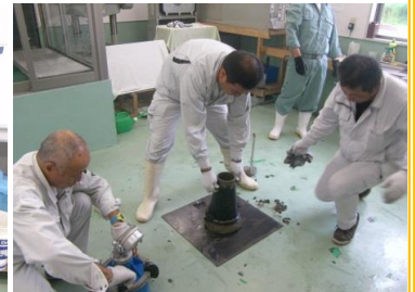
その4 スランプ試験器具にコンクリートを入れ、空洞ができないように詰め込む。