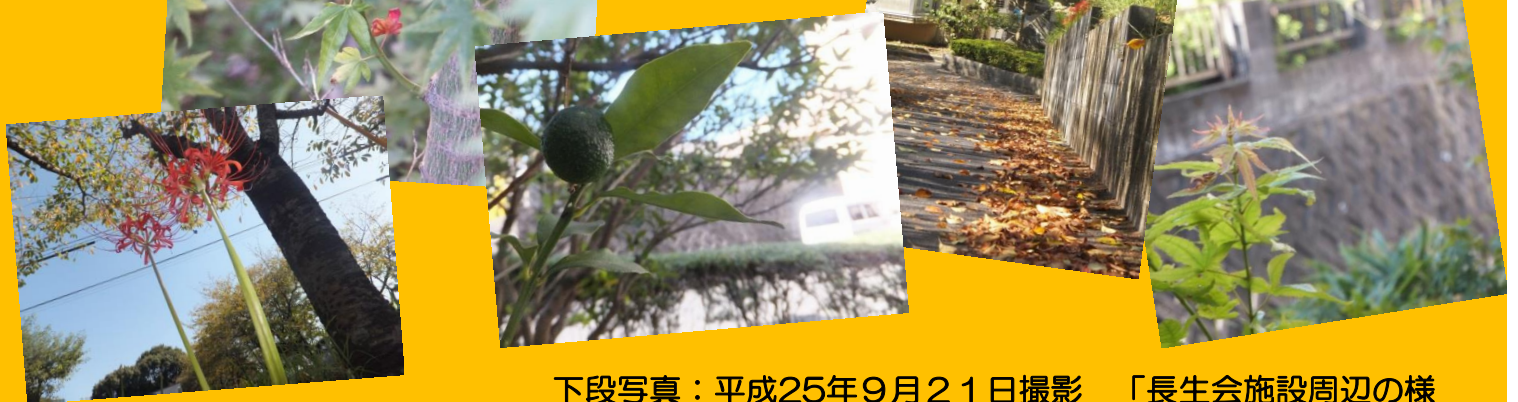
下段写真：平成25年9月21日撮影 「長生会施設周辺の様