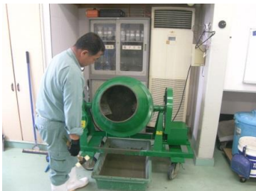
その3 ミキサーに材料を投入し数分間混ぜながら練る。