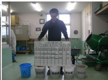
その2 試験体となる材料を正確に計測し、配合割合を確認する。