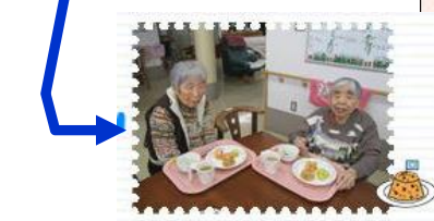
チキンライスのできあがり(〇)