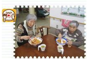
まぜまぜ、まぜまぜ