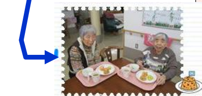
チキンライスのできあがり(〇)