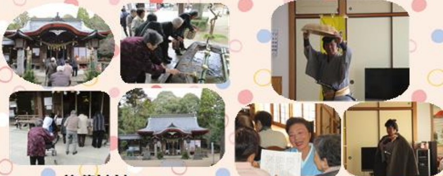
筑紫神社へ 初詣に行きました。