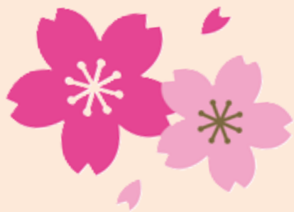
散歩の方などぜひお使いください