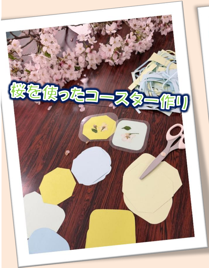
桜を使ったコースター作り