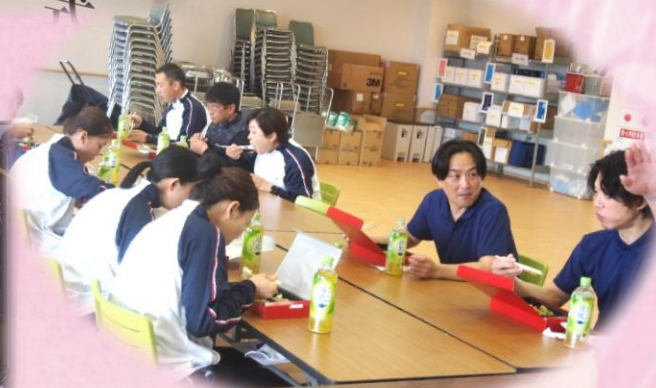
新職員歓迎昼食会の様子！