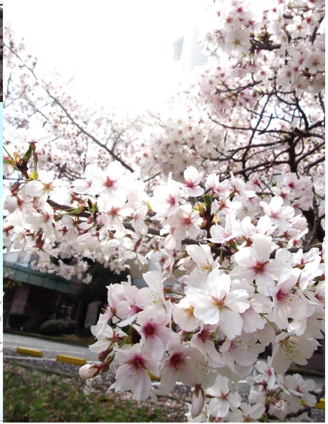
在宅福祉センター