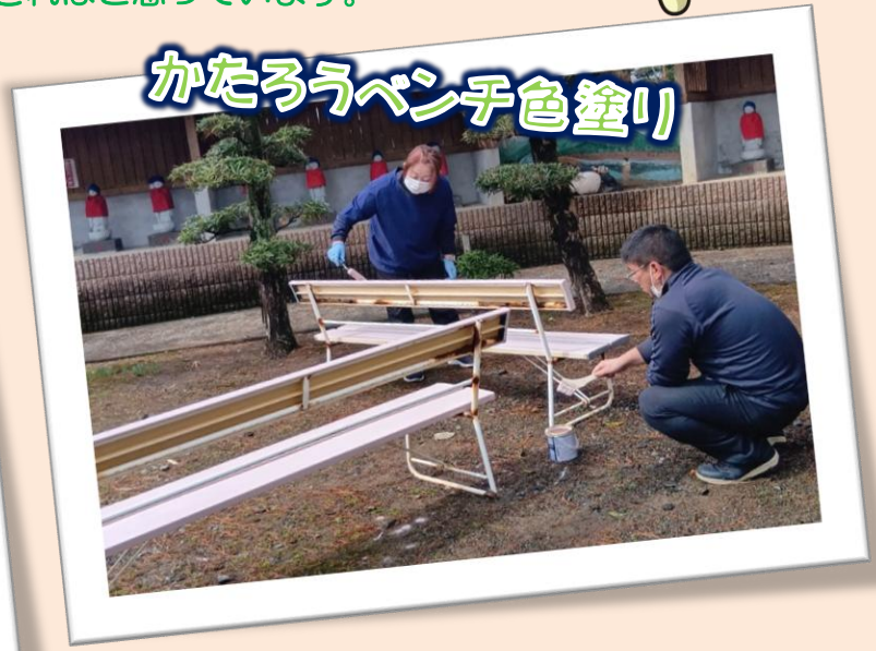
かたろうベンチ色塗り